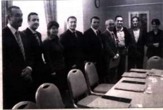
Toplantı Ealing'deki Holiday Inn otelinde Cuma günü gerçekleştirildi.

2005 Yılı için hazırlanan iş kataloğunda; öncelikle Türkiye ve Kıbrıs kökenli toplumumuza ait kronolojik olarak ve mesleki bazda tasnif edilmiş şirket, kurum ve kuruluşların adres bilgilerinin yer aldığı geniş bir rehberle birlikte, Londra ve UK iş hayatını ilgilendiren diğer geniş tanıtım ve her zaman ihtiyaç duyulabilecek güncel bilgiler yer almaktadır. 2005 UK Türk Business Kataloğunu İngilizce ve Türkçe olarak hazırlayan London Business Guide Org. yalnızca bir yıllık bir çalışma sonucunda sadece Londra'da değil UK genelinde Türkiye konusunu toplama ait Business datalarını bulunduran, UK Business Directory Kataloğu ve CD sini yakında 4 ölkede tarama ve dağıtım yapacak. Sadece Kitap olarak