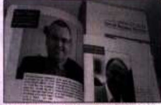
Hazırlanmış ve yayınlanmış olduğu Turkish Business Directory UK-EU 2006-07'yi geçtiğimiz haftalarda Türkiye'de dağıtımına başlandı.

Bu yılki Turkish Business Directory'de İngiliz ve Türk parlamenterler ve belediye başkanları başta olmak üzere tanınmış üst düzey Türk ve İngiliz yetkililerden "Neden Türkiye Avrupa Birliği'ne girmeli?" sorusuna verilen ilginç açıklamaları okuyabileceksiniz. Bunun yanı sıra başarılı olmuş üst düzey Türk yetkililerle onları başarıya götüren önemli prensipler hakkında yapılan söyleşileri keyifle okuma imkanına kavuşacaksınız. Yine bu yıl birçok yeniliğe imza atılan Turkish Business Directory UK-EU 2006-07 de İngiltere'de ilk kez iş destekleme (Business Support) konusunda bir bölüm hazırlanmıştır. Bu bölümde İngiltere'de ki iş geliştirme ve destekleme kurumlarının hizmetlerini ve tanıtımlarını bir arada bulma imkanı yakalayacaksınız. Ayrıca Türkiye ve Kıbrıs'ın tanıtımlarına yer verilen Turkish Business Directory UK-EU 2006-07 de yatırım yapmak isteyen bir çok yabancı kaynaklı kurum ve kuruluşları yakından ilgilendirecek bilgiler yer almaktadır.