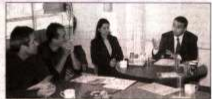
İş girişiminde bulunan yatırımcıya eğitim desteği sunulacak.